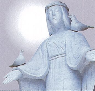
森の女神 Goddess of forest

日本を代表する尾瀬・谷川岳・玉原等、美しい自然景観に恵まれている森林文化都市「沼田」。 2001年8月1日に沼田に新しく生まれたホテル「ベラヴィータ」ここに住む市民や、この地を訪れたゲストの幸福と、自然の宝庫が永遠に美しくと願い「森の女神」は製作されました。 尚、この彫刻に使用された大理石は、イタリア・カララ産で2,000年前から採石されていて、ミケランジェロが採石した所と同じ丁場のものです。 (彫刻・明田一久)